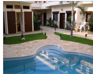
Piscina do Hotel em Tulum