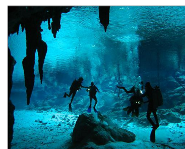
Cenote Dos Ojos