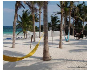
Praia de Tulum