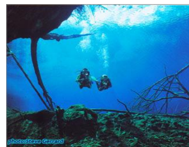
Cenote Car Wash