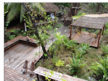
Cenote Nohoch Nah Chich