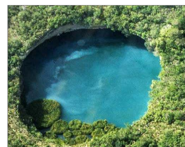
Cenote mexicano (vista aérea)